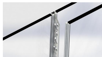
4/ Retirer l'intercalaire