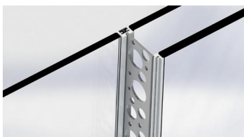
3/ Sortir le premier vitrage de la lisse