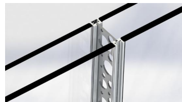
2/ Oter les pièces de jonction FIFTY