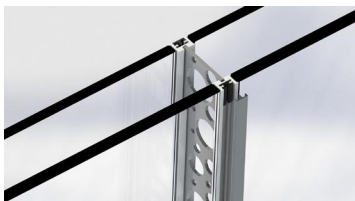
1/ Déclipper le couvre-joint FIFTY